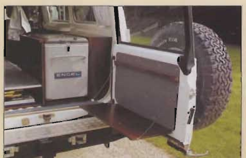
Le réfrigérateur est alimenté par une batterie Optifit D.