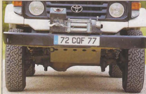
Un blindage efficace pour les passages de dunes difficiles.