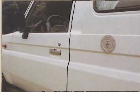
Attention à ne pas confondre ! il s'agit du remplissage d'eau.