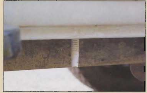
Le système d'évacuation de l'eau, un simple tube plastique.

Gwen s'étaient fixée. Qu'à cela ne tienne, ils sont en avance pour préparer leur HZJ 78 en vue de leur prochain voyage.