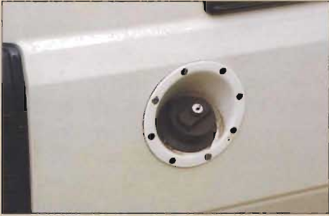
Le double réservoir est alimenté par un seule et même orifice.