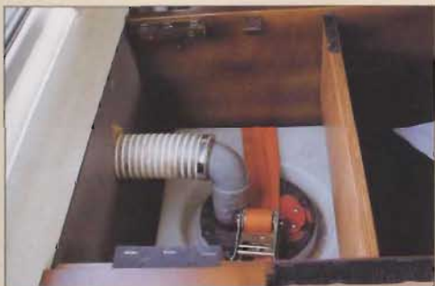
80 litres d'eau dans un réservoir signé Equip'raid.