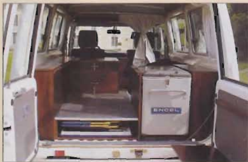
L'aménagement en bois type "marine".