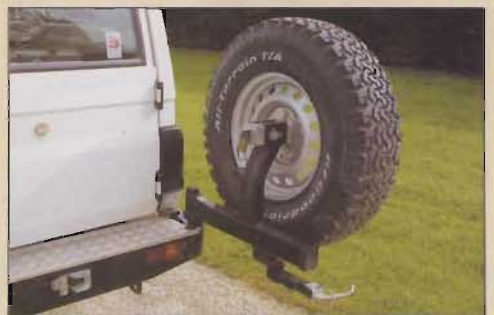
Les porte-roues ne sont pas solidaires des portes.