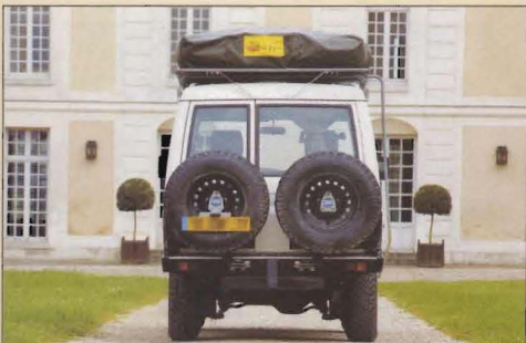
Deux roues de secours pour partir l'esprit tranquille.