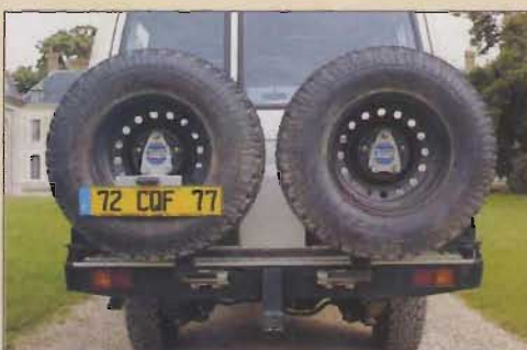
Le "double" porte-roues est installé par la concession Troublé.