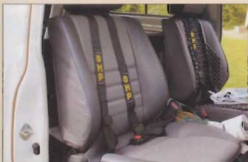
Pas de siège-baquet, le confort d'origine est apprécié.