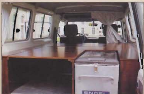
L'intérieur est rapidement transformé en chambre à coucher.