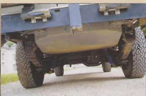
Un réservoir supplémentaire (australien) de 150 litres.