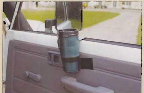
Le porte-bouteille, "on a vu ce gadget en Australie".