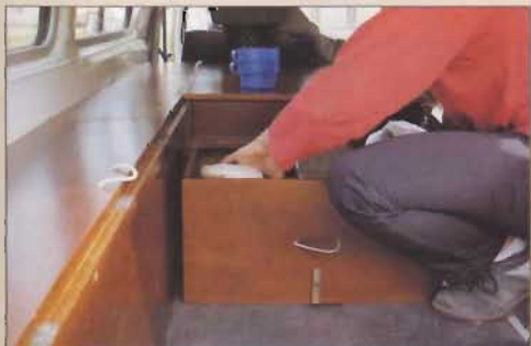
Les rangements sont fonctionnels et faciles d'accès.