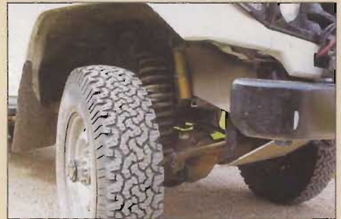
Les amortisseurs Proflex pour une meilleure efficacité en charge.

La mise à l'épreuve de leur nouveau compagnon de route se fera sur 20 000 km de